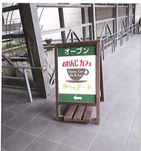
おれんじカフェ看板

今回2回目を10月7日に無事開催することが出来ましたので、紹介させていただきます。参加者は認知症の方とご家族5組11名でした。