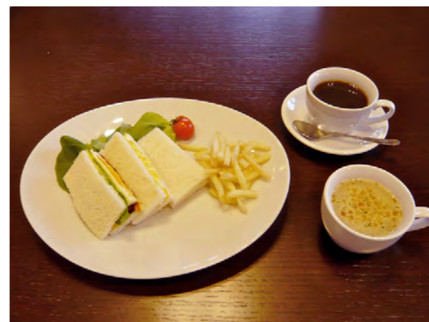
サンドイッチセット 450 サンドイッチ単品 300