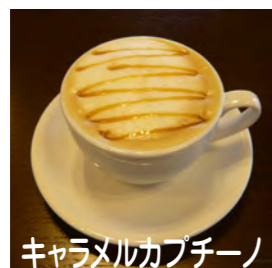
キャラメルカプチーノ