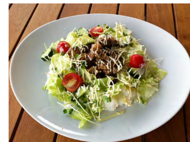
シシリアンライス 500 (スープまたはドリンク付)