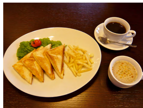
ホットサンドセット 450 ホットサンド単品 300