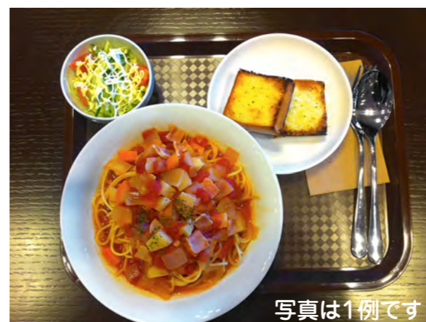
日替りランチプレート 500 (プラス100円でスープまたはドリンク付)

セットにはスープ、ドリンクが付いています。 ドリンクはコーヒー(ホット・アイス)、紅茶(ホット・アイス)、オレンジジュース、アップルジュース、グレープフルーツジュースから選べます。