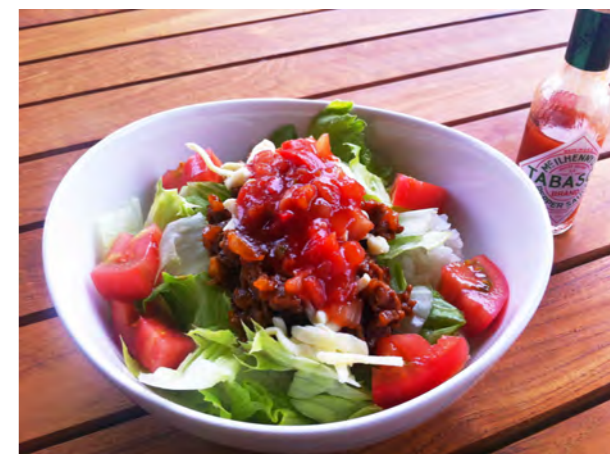
タコライス 500 (スープまたはドリンク付)

セットにはスープ、ドリンクが付いています。 ドリンクはコーヒー(ホット・アイス)、紅茶(ホット・アイス)、オレンジジュース、アップルジュース、グレープフルーツジュースから選べます。