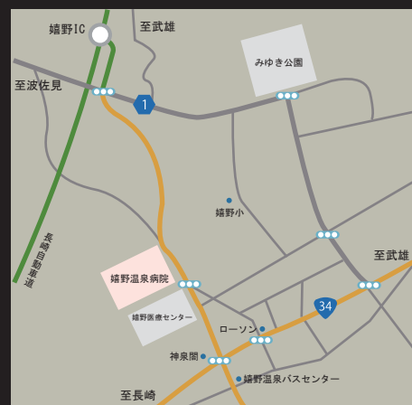
当院へのアクセスマップ